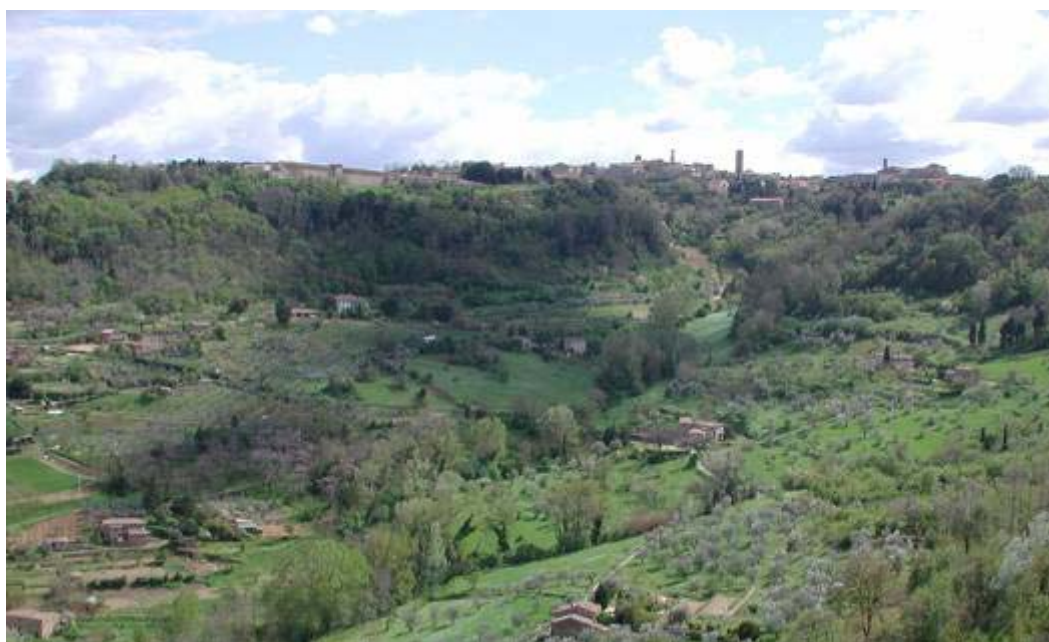
Le policolture agricole tradizionali creano paesaggi ricchi anche di biodiversità.

montagna e dell'arboricoltura asciutta meridionale ... (e) quelle del mercato, guidato dalle necessità della grande distribuzione che richiede una ridotta variabilità anche in termini qualitativi. L'erosione genetica ha in ogni caso riguardato soprattutto le aree di pianura - inizialmente nelle regioni settentrionali- dove i processi di intensificazione colturale hanno visto più facilmente e rapidamente la diffusione di impianti monovarietal, la scomparsa dei frutteti promiscui a carattere familiare, la rarefazione di alberate, siepi, fasce dove si trovavano spesso specie fruttifere cosiddette minori (gelso, sorbo, azzeruolo, ecc.) solitamente non coltivate su superfici specializzate. Questa biodiversità intraspecifica rimane comunque ancora elevata se si considera che un recente censimento delle risorse genetiche frutticole italiane elenca e brevemente descrive 3.065 varietà conservate presso diverse istituzioni, e ha riguardato soprattutto le specie a ciclo breve come il pesco e meno, per ovvie ragioni legate alla durata del ciclo vitale, specie come l'olivo.